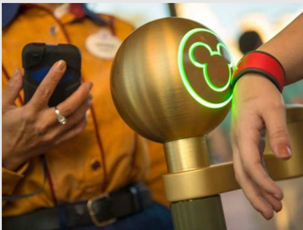
Pulseira registra dados que podem ser usados para criar campanhas personalizadas.

Estados Unidos - A Walt Disney está lançando novas tecnologias para serem usadas em suas instalações. Uma delas, a pulseira "MagicBand", acabou levantando uma polêmica sobre privacidade.