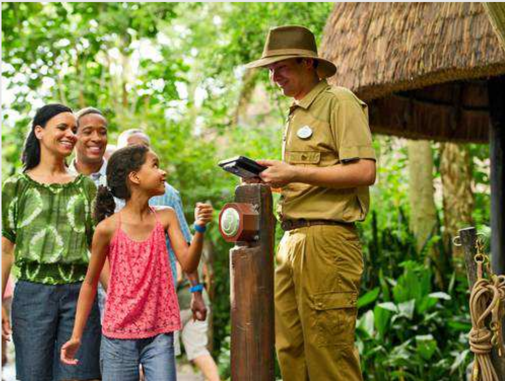
Uma visitante encosta sua pulseira com o chip no sensor de leitura da Disney.