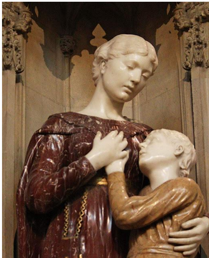
Santa Francisca Romana

“Lembra-te dos teus novíssimos e não pecarás” (Ecl. 7,40) – recomenda a Sagrada Escritura. Os novíssimos do homem são as últimas coisas que a ele ocorrerão, ou seja, a morte, o juízo particular, o Céu, o inferno, o purgatório, o fim do mundo, a ressurreição dos mortos e o juízo final.