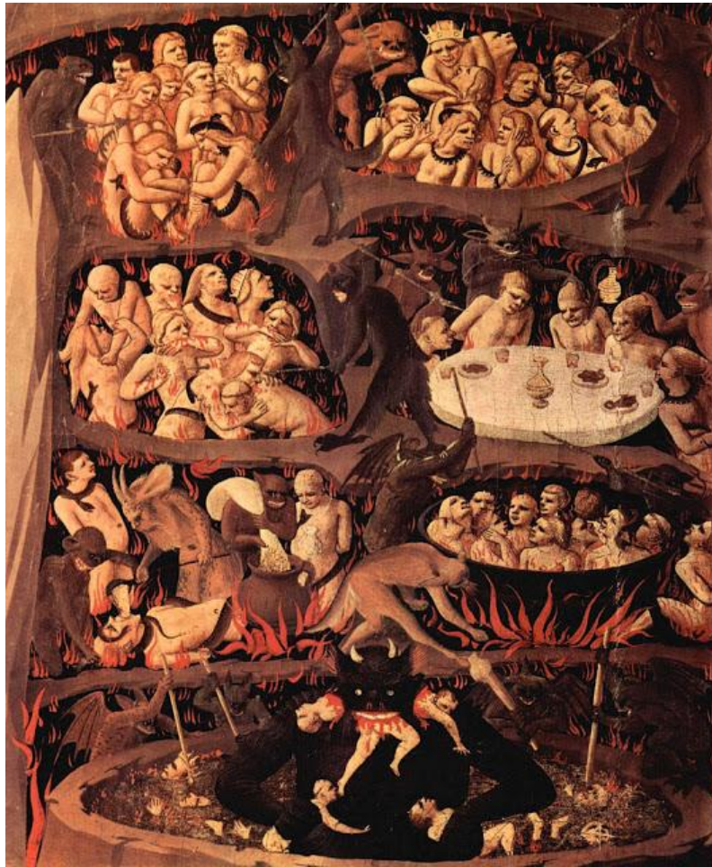
Inferno, Beato Angelico.

O inferno é dividido em três partes: o superior, o do meio e o inferior. Lúcifer encontra-se no fundo do inferno inferior. A Lúcifer, chefe universal, subordinam-se três outros demônios, os quais exercem império sobre os demais: